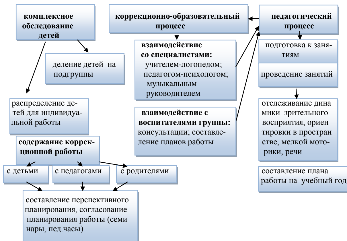
Схема организации работы учителя-логопеда

Основанием для зачисления ребенка в компенсирующую группу является выписка из заключения психолого-медико-педагогической комиссии МБОУ Центр ПМСС «С любовью к детям» и заявление родителя (законного представителя).